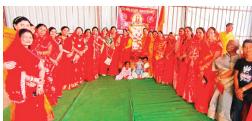
हरिभूमि न्यूज़ सारंगपुर

प्रतिवर्ष अनुसार इस वर्ष भी गुर्जर गौड़ ब्राह्मण समाज नगर इकाई के तत्वावधान में गुरुवार को बालाजी गार्डन में अपने आराध्य देव भगवान गौतम ऋषि का जन्म उत्सव धूमधाम से मनाया गया। समाज की महिलाओं द्वारा कलश यात्रा निकाली गई जो नगर के विभिन्न मार्गों से होती हुई कार्यक्रम स्थल पहुंची। कलश यात्रा का जगह-जगह पुष्प वर्षा का स्वागत किया गया। सभी समाजजनों एवं महिलाओं ने मिलकर विधि विधान के साथ भगवान गौतम ऋषि का पूजन कर महा