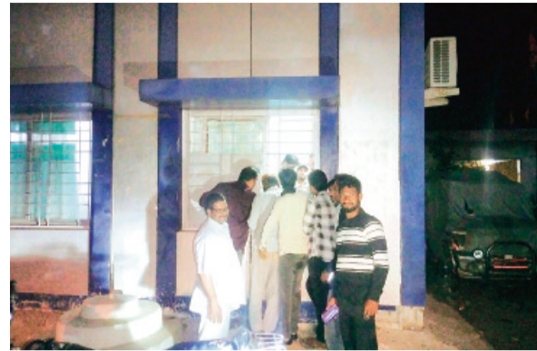
हरिभूमि न्यूज़ सारंगपुर

विद्युत वितरण कंपनी द्वारा शहर में स्मार्ट मीटर लगाने का कार्य तेजी से किया जा रहा है, लेकिन इसकी सही जानकारी के अभाव में अब उपभोक्ताओं को भारी परेशानी का सामना करना पड़ रहा है। शहर में स्मार्ट मीटर लगाए जाने के बाद अचानक सैकड़ों उपभोक्ताओं की बिजली सप्लाई बाधित हो गई, जिससे कई इलाकों में अंधेरा छा गया। उपभोक्ताओं का आरोप है कि उन्हें न तो बिल की समय पर जानकारी दी गई और न ही भुगतान की अंतिम तिथि के बारे में अवगत कराया गया। उपभोक्ताओं ने बताया कि स्मार्ट मीटर लगने के बाद न तो